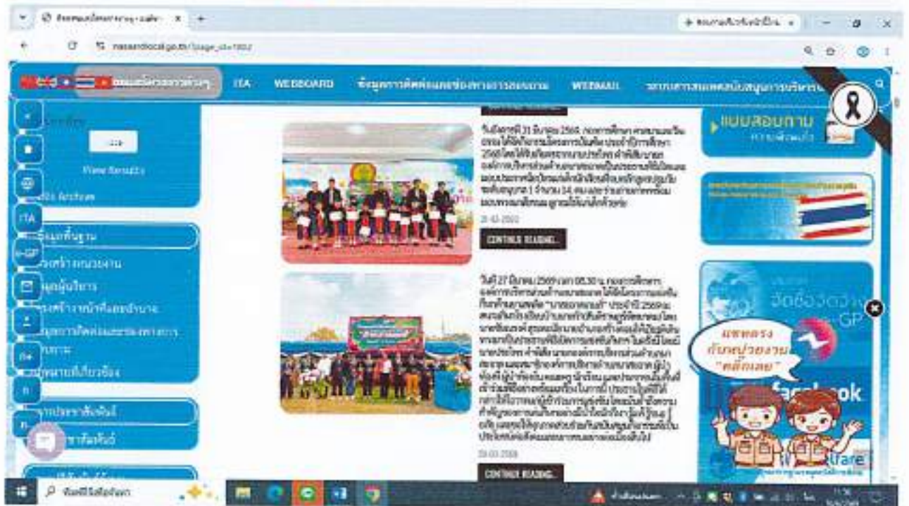
การดำเนินงานตามอำนาจหน้าที่หรือภารกิจหลัก ปีงบประมาณ พ.ศ. ๒๕๖๙