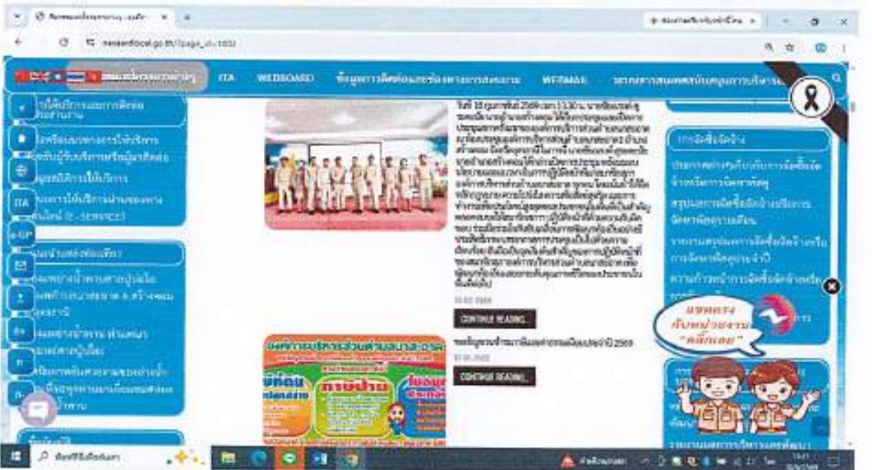
การดำเนินงานตามอำนาจหน้าที่หรือภารกิจหลัก ปีงบประมาณ พ.ศ. ๒๕๖๔